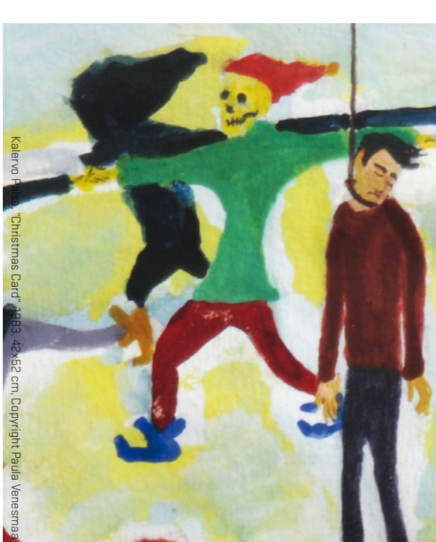
Kalervo Palsa, Christmas Card, 1993, 46x52 cm